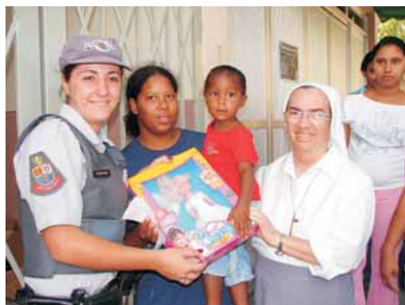
Natal: Conseg - Rotary - Jornal Estância