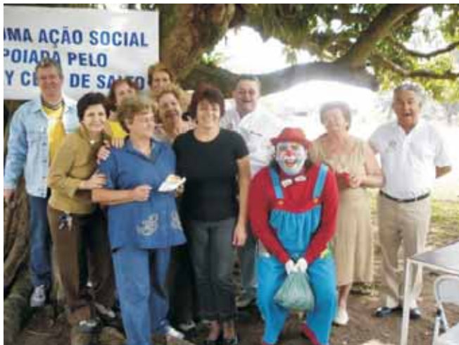
Rotarianos e esposas com o palhaço Pirapopó de Itu, na Ação Social do dia 27 de agosto...

Aconteceu uma grande promoção social no último dia 27 de agosto lá no Pesqueiro do Tado, quando o Rotary Club de Salto, promoveu alegrias para mais de 600 crianças, ofertando lanches, balas e refrescos estes da Brassuco de Itu(gentil oferta), colaborando assim com as atenções solicitadas pelo Ivan do Pesqueiro e do Zé do Algodão Doce.