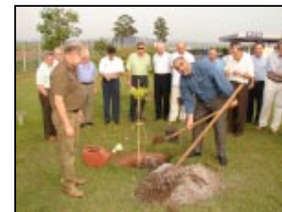
Gov. Zanco e Pres. Argemiro plantam a árvore do rotary.